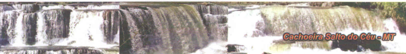
Cachoeira Salto do Céu - MT