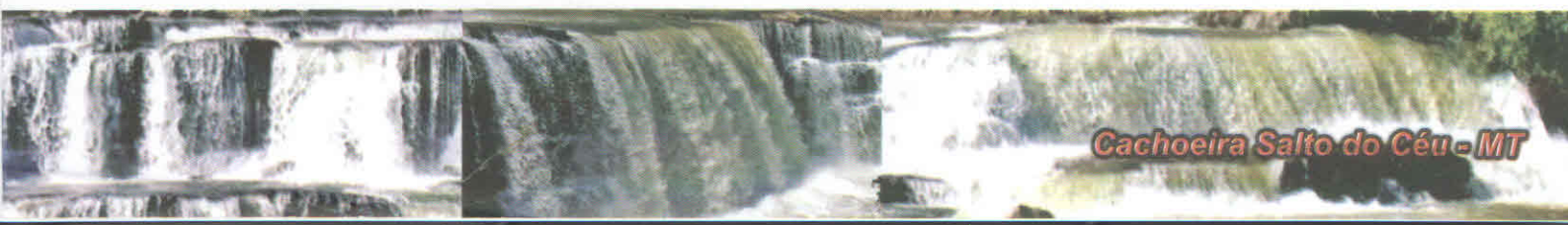
Cachoeira Salto do Céu - MT