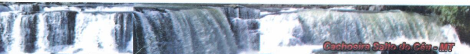
WEMERSON ADÃO PRATA PREFEITO DE SALTO DO CÉU - MT

Salto do Céu - MT, 18 de Outubro de 2019.