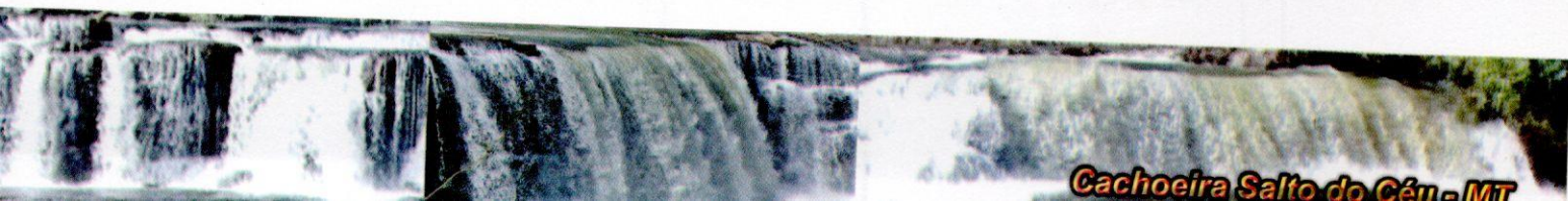
Cachoeira Salto do Céu - MT